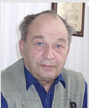
БОЛДЫРЕВ Владимир Вячеславович Академик РАН

Ю.И. Шокин награжден орденом «Знак Почета» (1982 г.), орденом Дружбы (1999 г.). С 1993 г. по 2001 г. Шокин Ю.И. являлся председателем Библиотечного совета при Президиуме РАН.