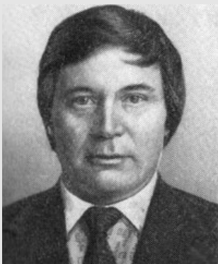
ЕРШОВ Юрий Леонидович Член-корреспондент АН СССР (1970). Академик (1991)

Родился 1 мая 1940 г. Математик, специалист в области алгебры и математической логики. Основные труды по теории алгоритмов, теории моделей и теории чисел.