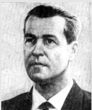
ОВСЯННИКОВ Лев Васильевич Член-корреспондент АН СССР (1964). Академик (1987)

Исполняла обязанности ученого секретаря Библиотечного совета при Президиуме СО АН СССР с 1958 по 1974 г.