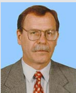
ШОКИН Юрий Иванович Член-корреспондент АН СССР (1984). Академик (1994)

Член Библиотечного совета при Президиуме СО АН СССР (1976–1983), Председатель Библиотечного совета (1983–1990).